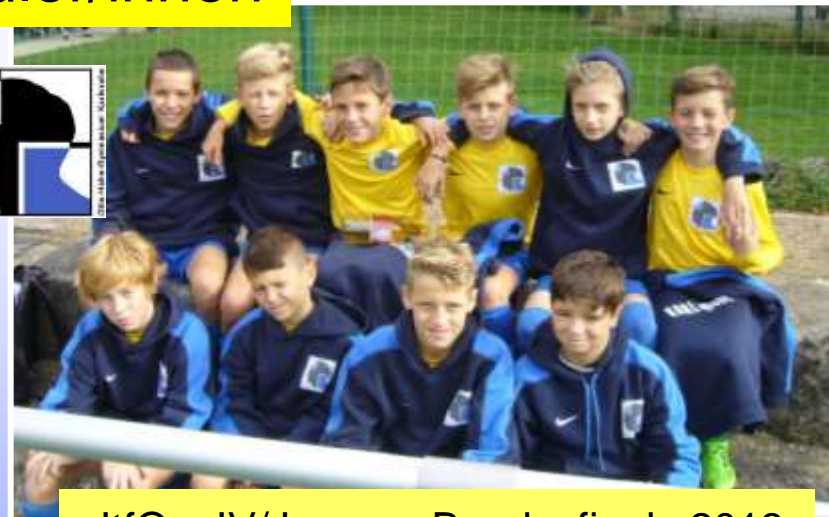
JtfO – IV/Jungen, Bundesfinale 2013