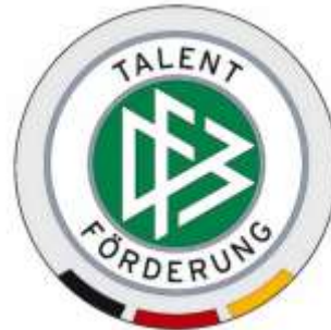
Eliteschule des Fußballs